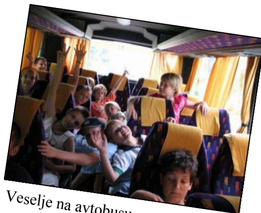
Veselje na avtobusu.