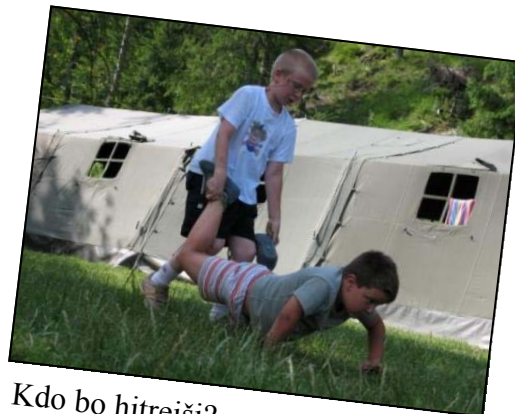
Kdo bo hitrejši?

Sreda je bila namenjena zabavi in sprostitvi: tekom dneva so se vrstile različne taborne igre, tekmovali smo v pravem olimpijskem vzdušju!