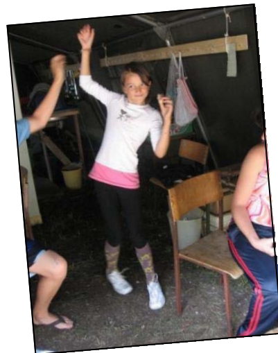
Resnično narobe dan!