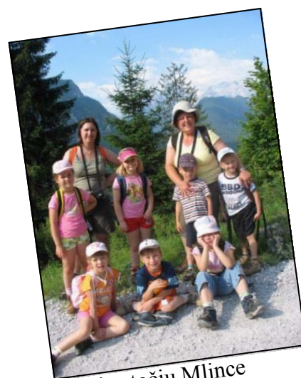
Proti sotočju Mlince

Prva tura je bila namenjena spoznavanju širše okolice tabora: ogledali smo si slap Peričnik, namakali smo se v sotočju Mlince in nasploh uživali v svežem gorskem zraku.