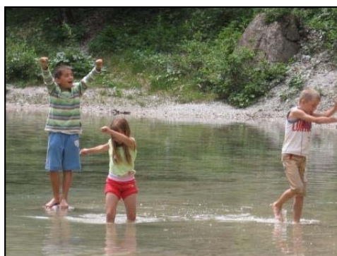
Hlajenje v vodi po naporni turi.

Na drugi turi smo spoznavali osnove, kako preživeti v naravi in si seveda privoščili osvežitve v bližnjem potoku.