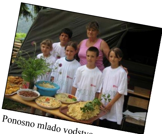
Ponosno mlado vodstvo