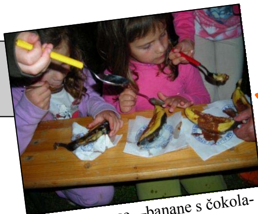
Nagrada za vse—banane s čokola-

Ponedeljek 30.6.2008 »ORIENTACIJSKO TEKMOVANJE«