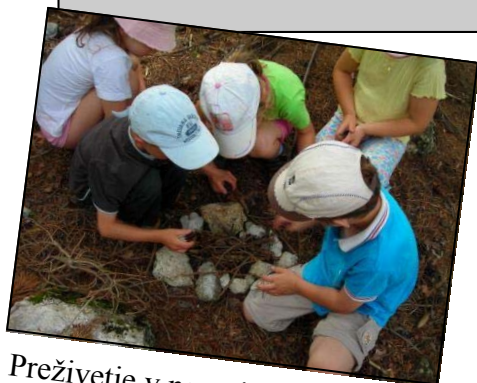
Preživetje v naravi