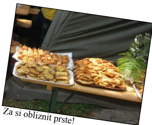
Za si obliznit prste!