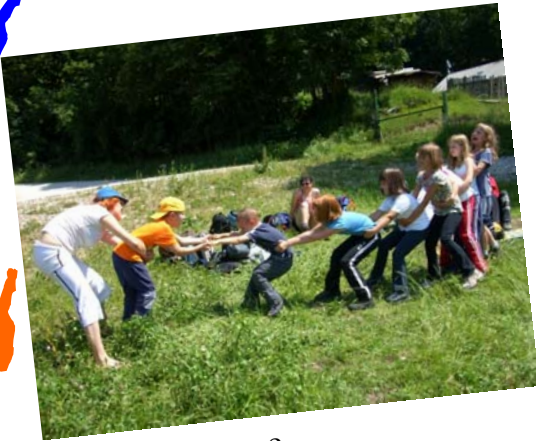
Ali je trden most?