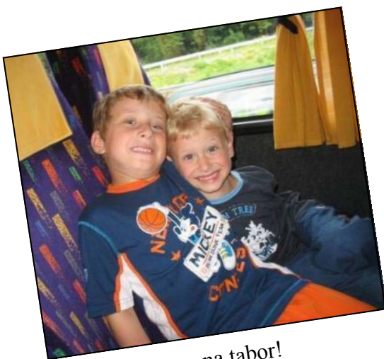
Midva pa greva na tabor!

V soboto smo se poslovili od staršev in se z avtobusom zapeljali novim dogodivščinam nasproti!