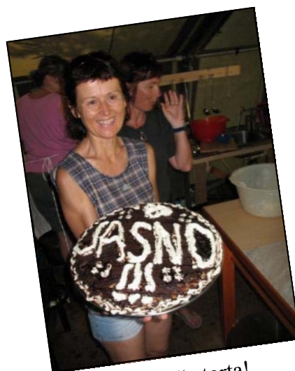
Na koncu pa še torta!