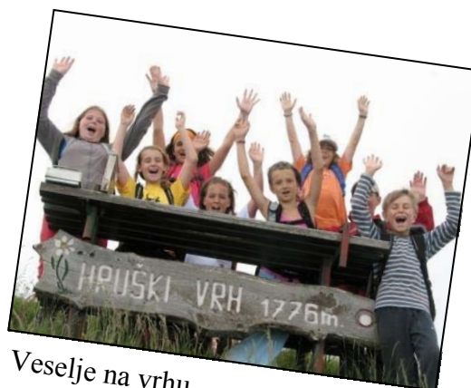
Veselje na vrhu

Ta dan smo izpeljali še zadnjo planinsko turo: največji smo si ogledali spodnji in zgornji slap Peričnik, nekateri smo osvojili Hruški vrh, ostali pa Dovško Babo. Ta dan je bilo vreme res idelano, tako da smo