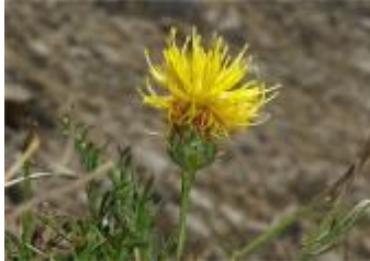
Skalni glavinec Centaurea rupestris