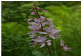
Navadni jesenček Dictamnus albus