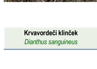
Krvavordeči klinček Dianthus sanguineus