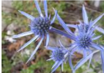
Ametistasta možina Eryngium amethystinum