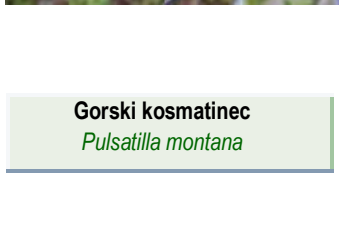
Gorski kosmatinec Pulsatilla montana