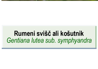
Rumeni svišč ali košutnik Gentiana lutea sub. symphyandra