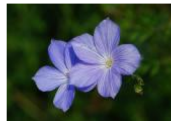
Francoski lan Linum nabornense