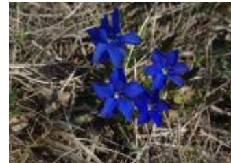
Tržaški svišč Gentiana tergestina