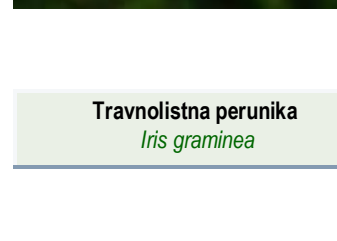
Travnolistna perunika Iris graminea