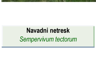
Navadni netresk Sempervivum tectorum