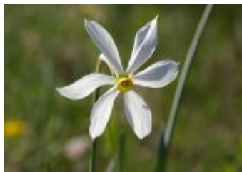
Gorska narcisa Narcissus radiflorus