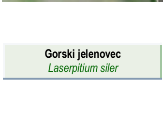
Gorski jelenovec Laserpitium siler