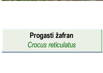
Progasti žafran Crocus reticulatus