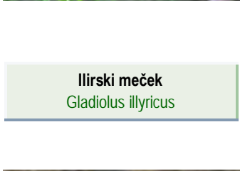
Ilirski meček Gladiolus illyricus