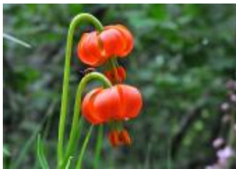
Kranjska lilija ali zlato jabolko Lilium carniolicum