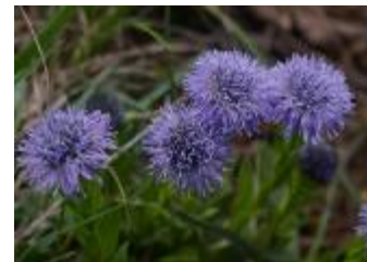
Navadna mračica Globularia punctata