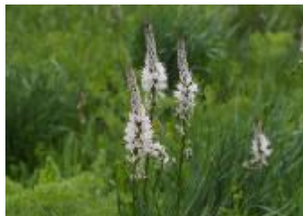
Navadni zlati koren Asphodelus albus

Uživajmo v prelepem pogledu na raznovrstno cvetje! Domov ga odnašajmo le v svojem spominu in fotografskem aparatu!