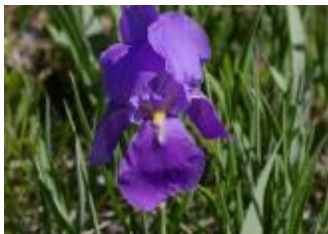
Ilirska perunika Iris illirica