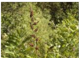
Črna čmerika Veratrum nigrum