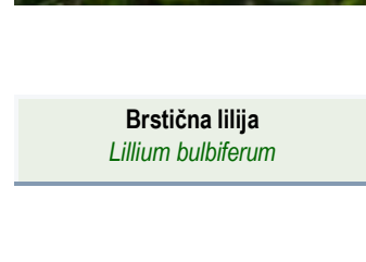
Brstična lilija Lilium bulbiferum