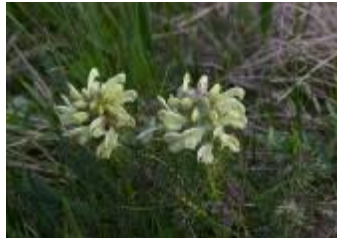
Bledorumeni ušivec Pedicularis frederici-augusti