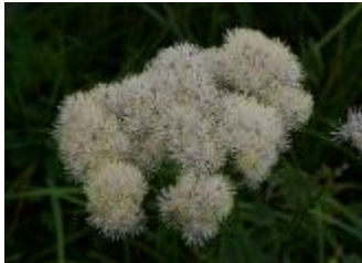
Talin ali vetrovka Thalictrum aquilegifolium